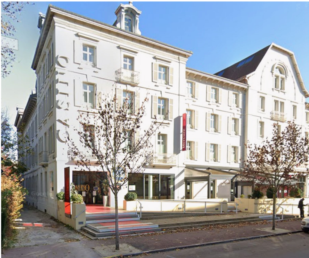
Cession de locaux situés 158 avenue Bouloumié à Vittel – Appel à manifestation d'intérêt – Février 2026