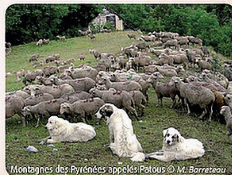
Montagnes des Pyrénées appelés Patous © M. Barretau